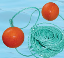
Спасательные шары и нагрудники